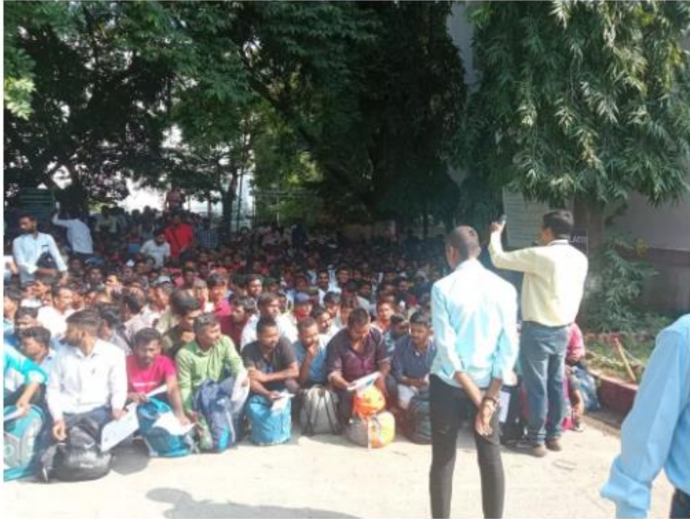
Illustrated Daily News

Illustrated Daily News | 22 September 2024 6:58 PM