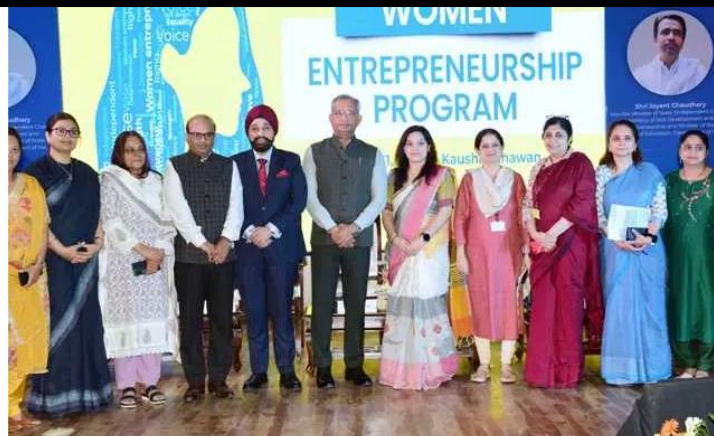
NSDC In Partnership With Britannia Launches Women Entrepreneurship Program