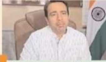
स्किल इंडिया व डिजिटल इंडिया का मिलाजुला स्वरूप है एसआईडीएच : जयंत

मंत्री को और से आगे कहा गया कि इस प्लेटफॉर्म का प्राथमिक उद्देश्य स्किल डेवलपमेंट के लिए एक ऐसा प्लेटफॉर्म तैयार करना है जो कि इंटरनेट से जुड़े कोर्स युवाओं को ऑफर कर सके, जिससे उन्हें रोजगार पाने में आसानी हो। मंत्री ने आगे कहा कि एसआईडीएच भारत सरकार को दो बड़ी पहल स्किल इंडिया और डिजिटल इंडिया का मिलाजुला स्वरूप है। इसका उद्देश्य भारत के डिजिटल पब्लिक इन्फ्रास्ट्रक्चर (डीपीआई) को