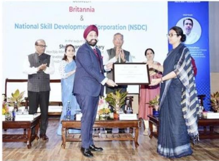
A view of women entrepreneurship programme.

The initiative will culminate in a grand finale where the top 50 contestants will present their business ideas