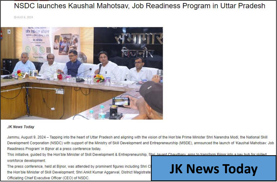
JK News Today