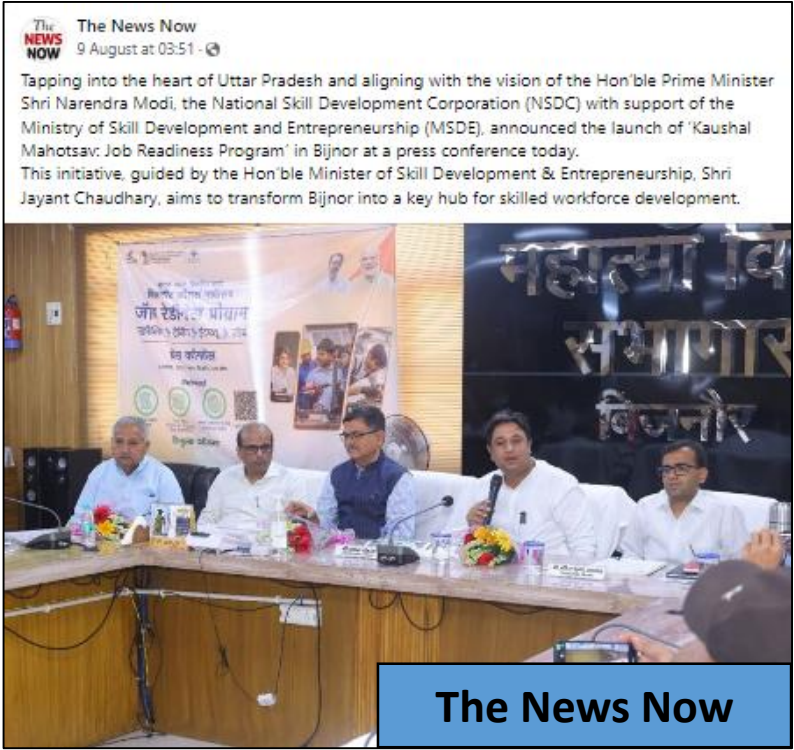
The News Now