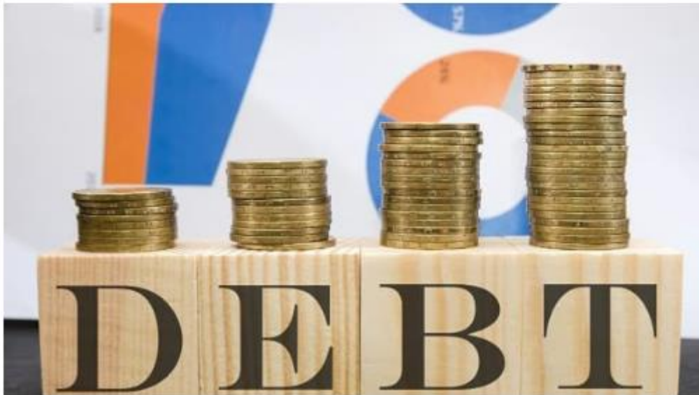
Govt launches revamped scheme to facilitate skill loans of up to Rs 7.5 lakh PSU Watch

The Government on Thursday launched the revamped Model Skill Loan Scheme to facilitate loans up to Rs 7.5 lakh with a guarantee from a government-promoted fund