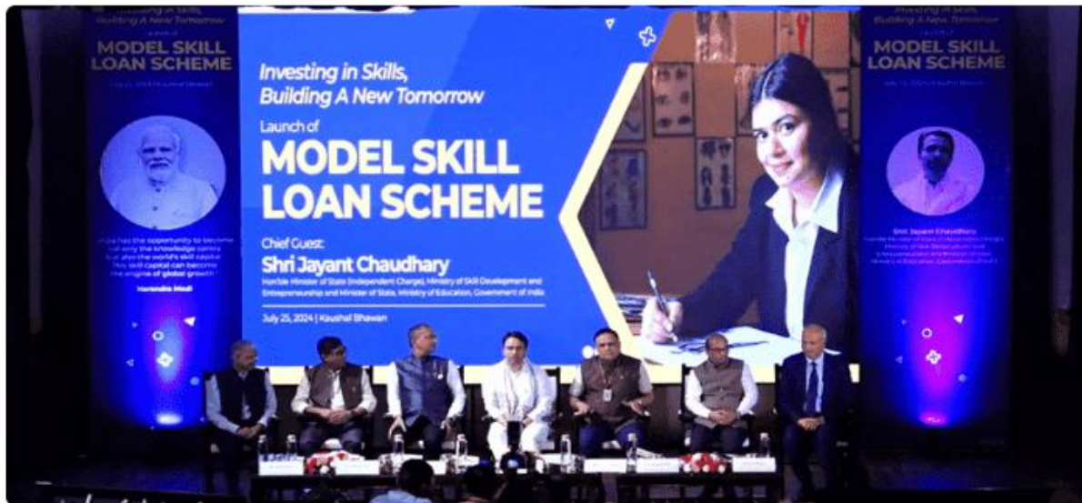
Model skill loan scheme launched by skill minister Jayant Chaudhary today.

Model skill loan scheme revised by the skill ministry Includes courses such as AI, data science, health care and Institutions such as NFBCs, MFL.