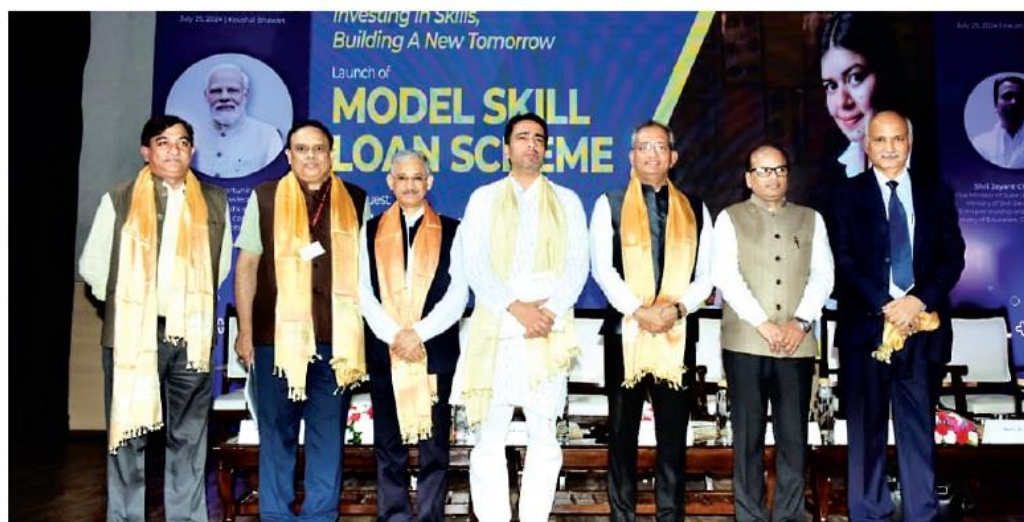
Union Minister Jayant Chaudhary and others at a ceremony.

The scheme is aimed at providing easy access to advanced-level skill courses, which potentially pose a significant financial barrier for many deserving students and candidates to gain