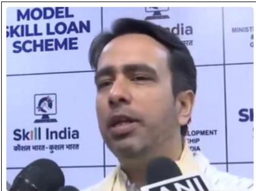
Union MoS Jayant Chaudhary