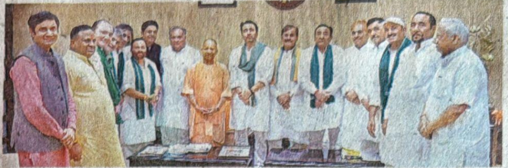
मुख्यमंत्री योगी आदित्यनाथ से गुरुवार को उनके सरकारी आवास पर केंद्रीय राज्यमंत्री (स्वतंत्र प्रभार) व राष्ट्रीय लोक दल के राष्ट्रीय अध्यक्ष जयंत चौधरी ने पार्टी नेताओं के साथ मुलाकात की

राज्य ब्यूरो, जागरण • लखनऊ : केंद्रीय राज्यमंत्री बनने के बाद गुरुवार को पहली बार लखनऊ पहुंचे राष्ट्रीय लोकदल के अध्यक्ष जयंत चौधरी संसद में जाति के मुद्दे पर अपने पुराने साथी सपा अध्यक्ष अखिलेश यादव पर निशाना साधा। कहा, संविधान कोई नहीं बदल सकता है। संसद में जाति को लेकर इस तरह की तस्वीर दिखाना नियम विरुद्ध है। बार-बार संसद में प्रतिबंध भी लगाया जा रहा है। इसके बावजूद संसद की अवमानना हो रही है। अखिलेश का नाम लिए बिना उन्होंने कहा, मीडिया के सवाल पर बार-बार उनके मालिक का नाम पूछते हुए उनको (अखिलेश) देखा है। वह परेशान हैं। विधानसभा की 10 सीटों पर होने वाले उपचुनाव में रालोद की सीटों पर कुछ भी स्पष्ट कहने से बचते हुए उन्होंने इतना ही साफ किया कि उनकी पार्टी भाजपा गठबंधन के साथ उपचुनाव लड़ेगी।