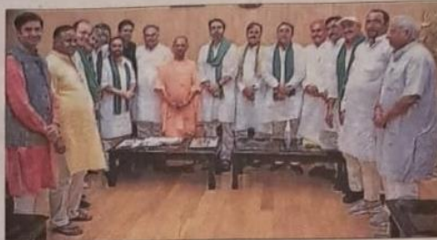
RLD chief and Union minister Jayant Chaudhary with chief minister Yogi Adityanath in Lucknow on Thursday