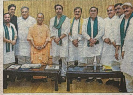
केंद्रीय मंत्री जयंत चौधरी ने गुरुवार को मुख्यमंत्री योगी आदित्यनाथ से मुलाकात की।